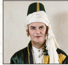
Orsino (hertug i Illyrien) Troels Lyby